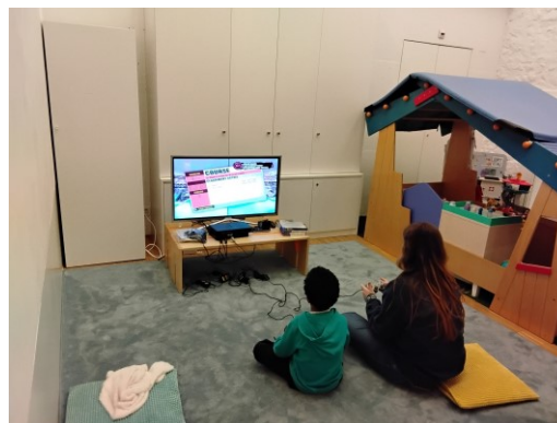
Soirée jeux vidéo