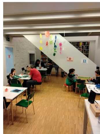
Soirée jeux de rôle