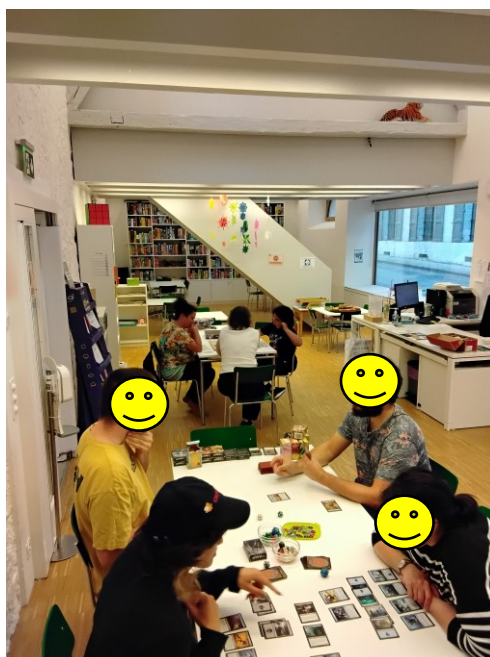
Soirée Magic et Lorcana